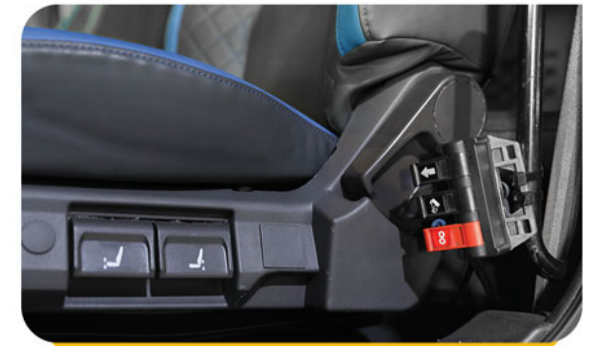
تنظیم کمپرسی از طریق کنترلر