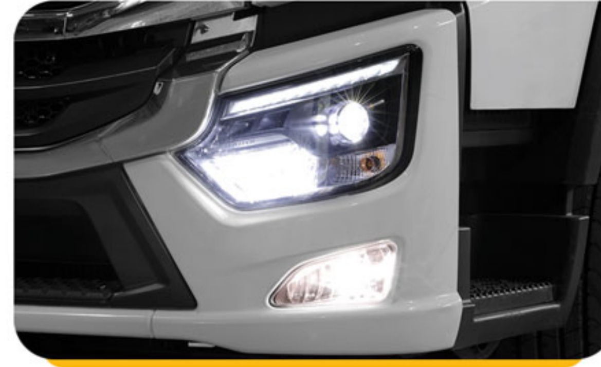
چراغ جلو LED جهت دید بهتر و ایمن در شرایط مختلف