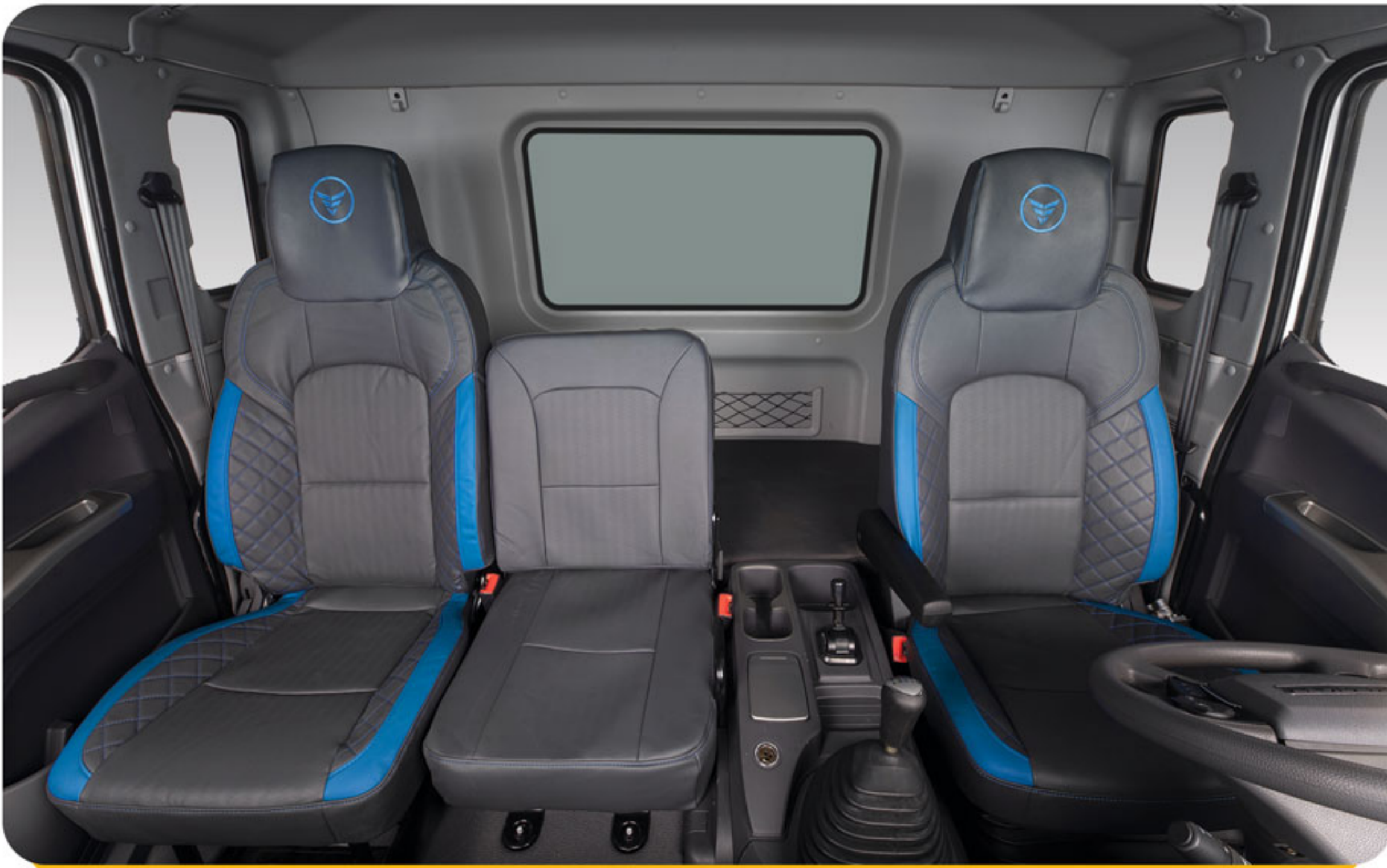
تخت خواب بزرگ و صندلی میانی