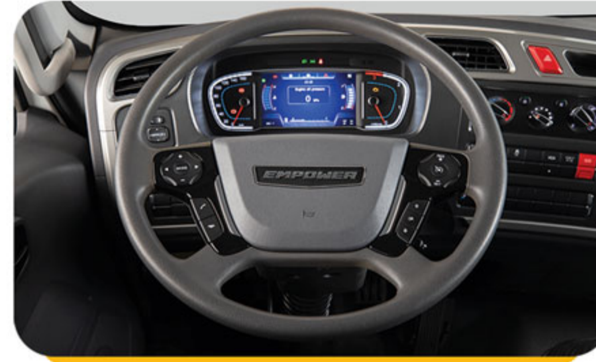
غریبک فرمان مجهز به کلیدهای دسترسی به مولتی مدیا و کروز کنترل