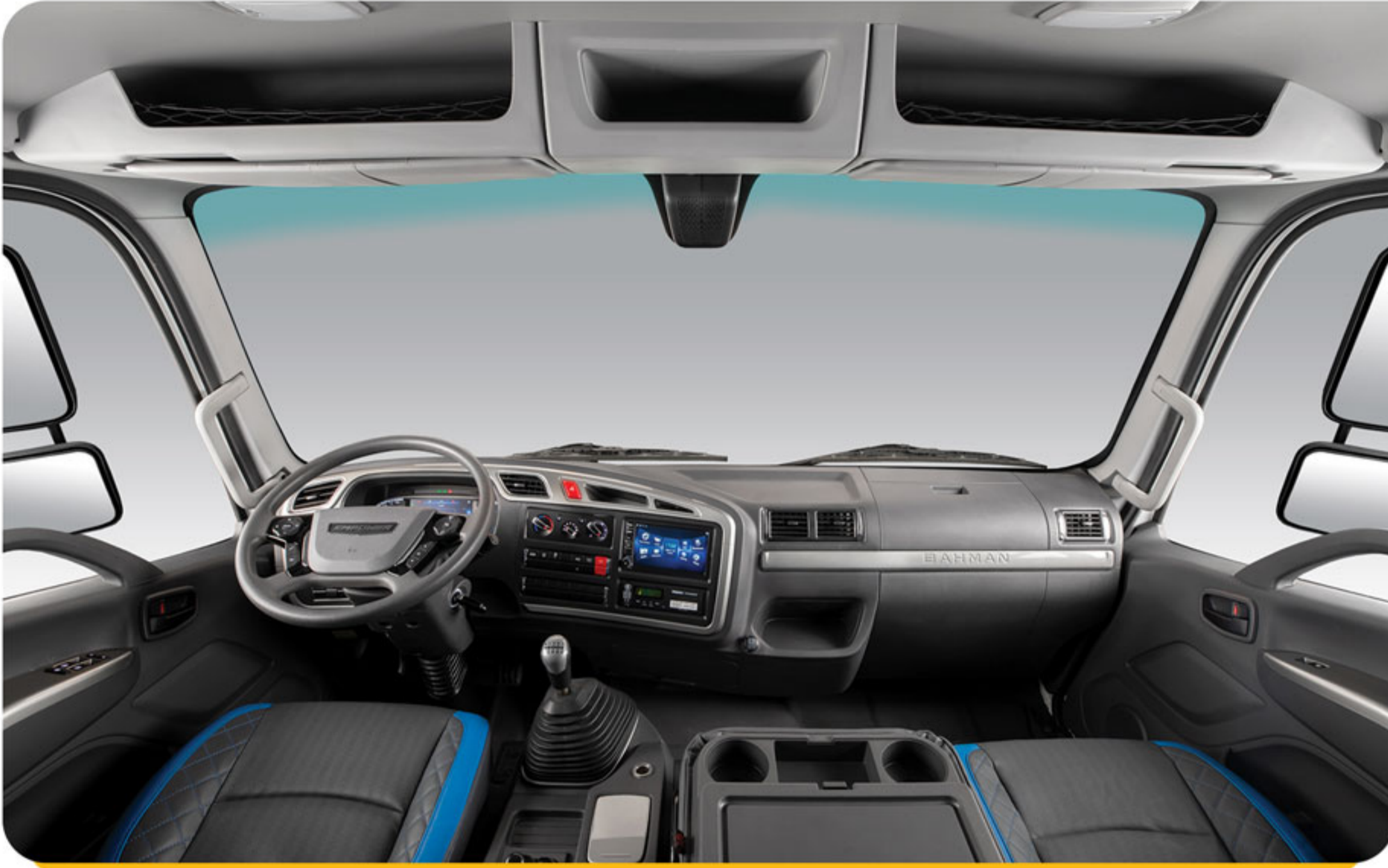
کابین بزرگ، ارگونومیک و مدرن