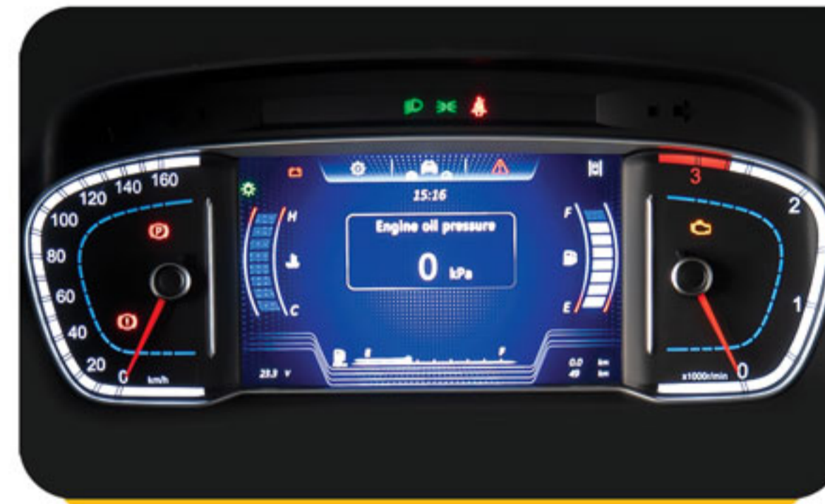
جلو آمپر با صفحه نمایش TFT