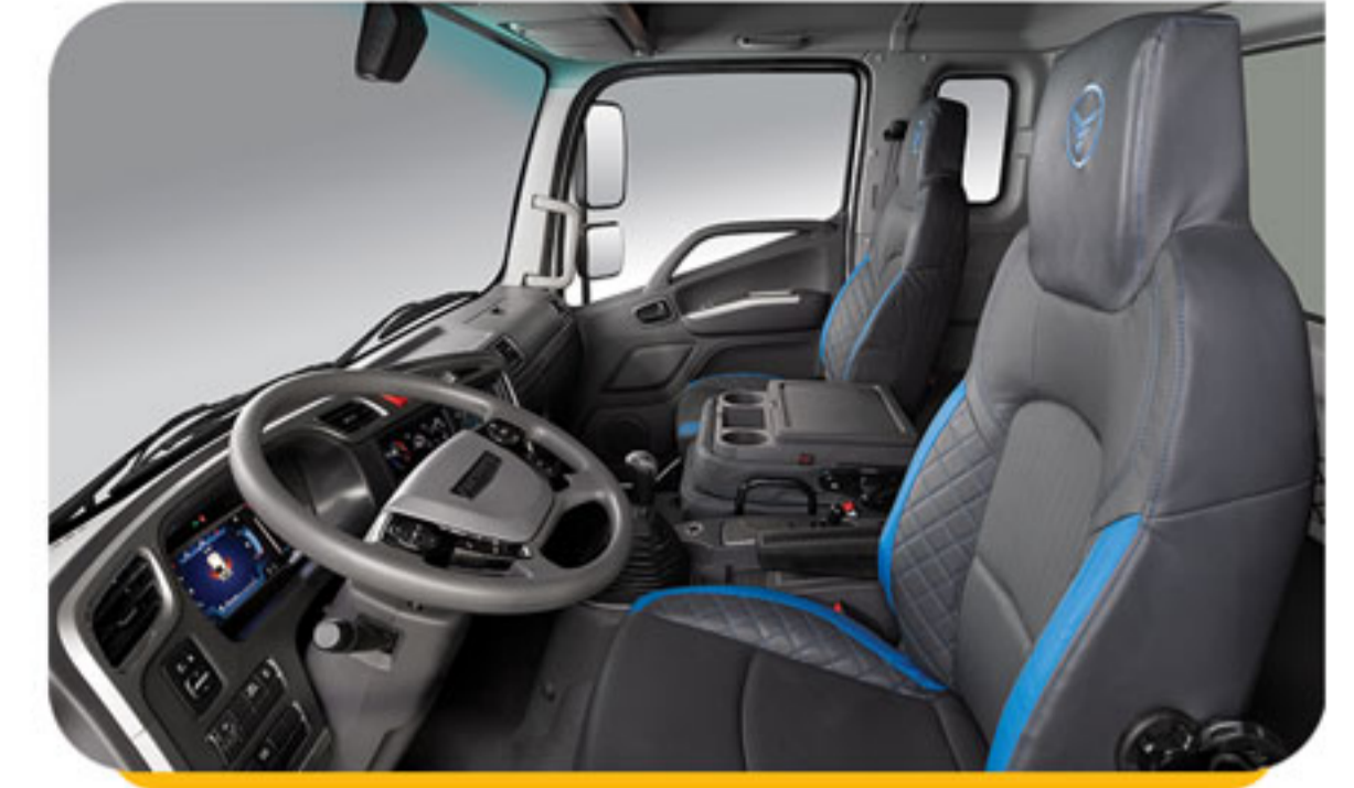
قابلیت تبدیل صندلی میانی به کنسول و جالیوانی