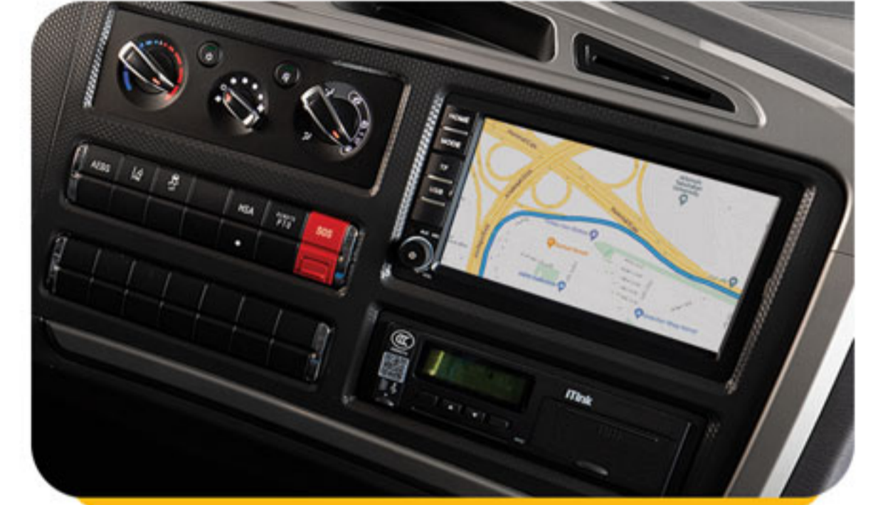
مولتی مدیا TFT لمسی (رادیو، رهیاب، بلوتوث، USB، SD)