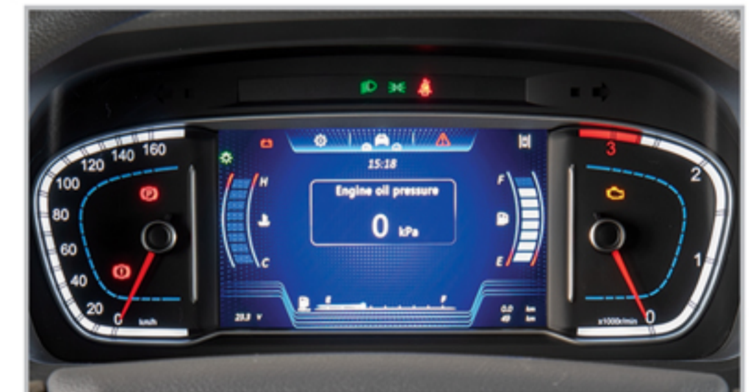
جلو آمپر با صفحه نمایش TFT