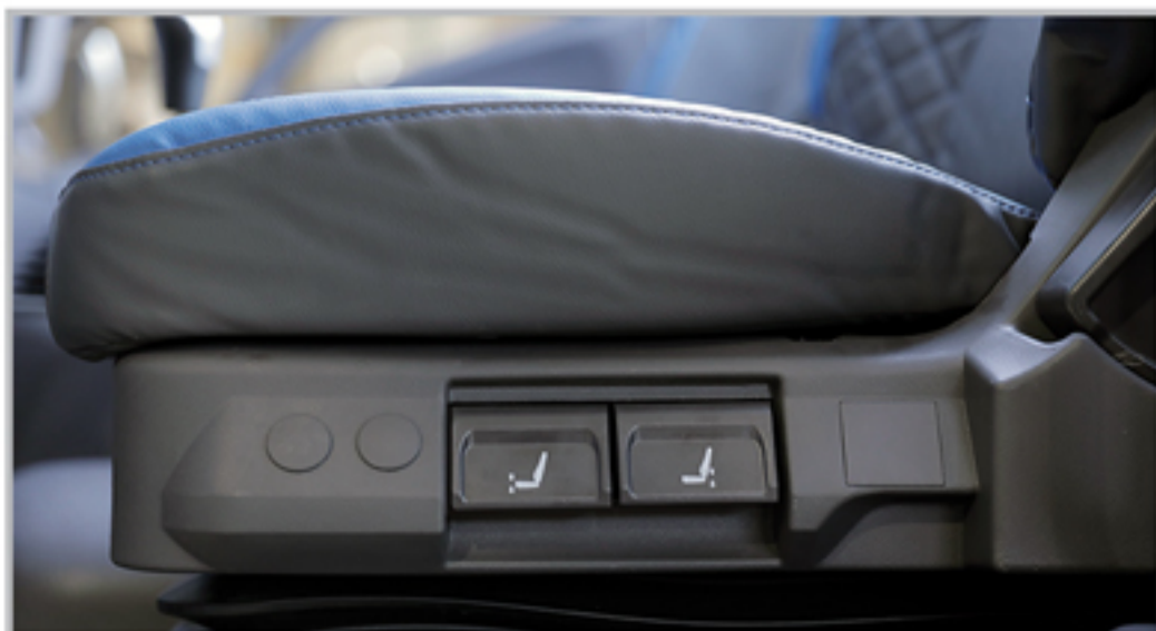
صندلی پنوماتیک راننده با قابلیت تنظیم در ۶ جهت