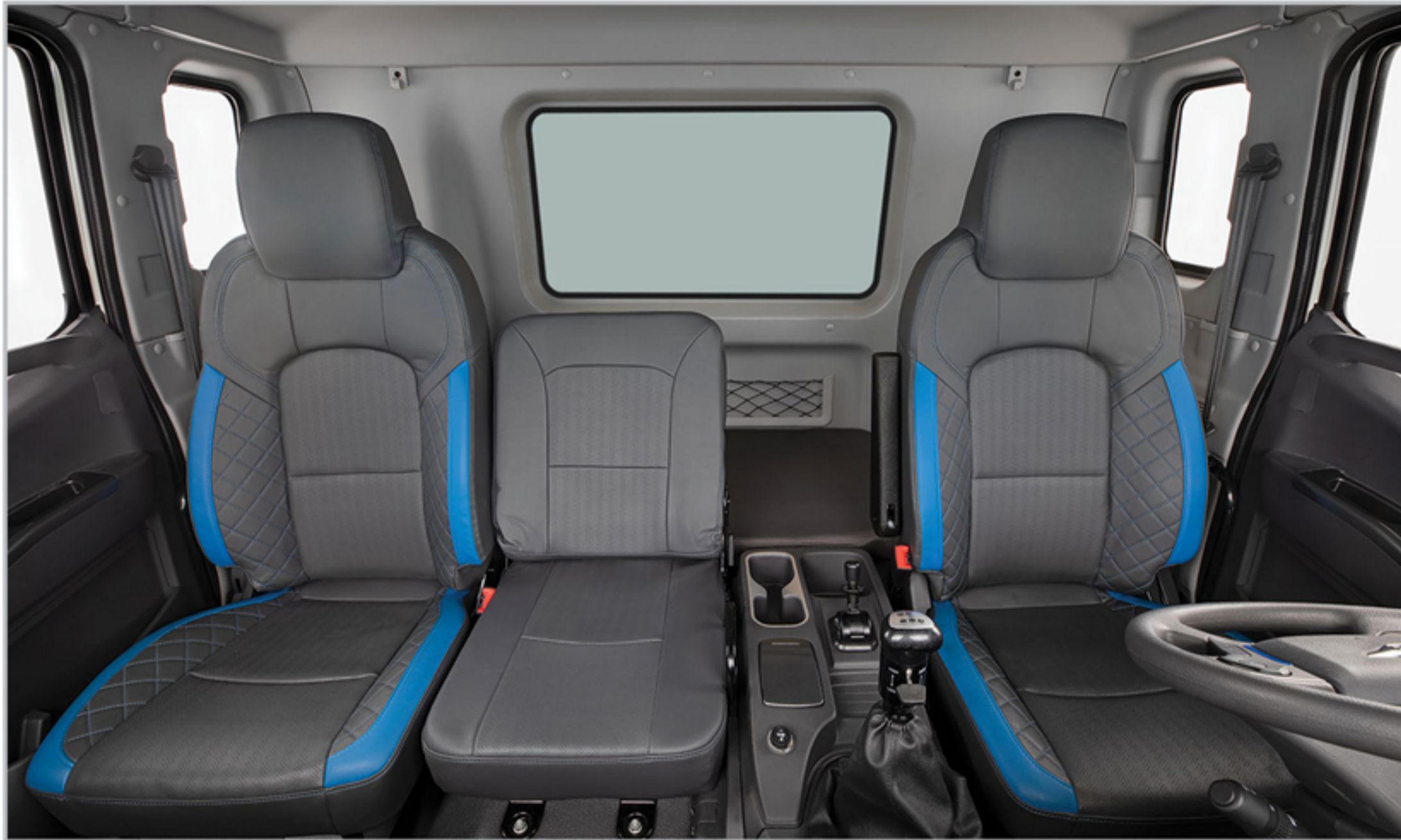
تخت خواب بزرگ و صندلی میانی