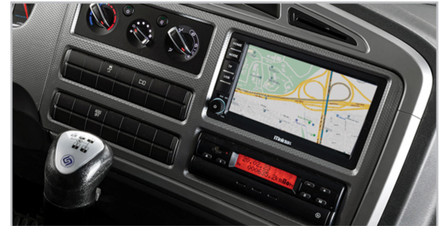
مولتی مدیا TFT لمسی (رادیو، رهیاب، بلوتوث، USB، SD)