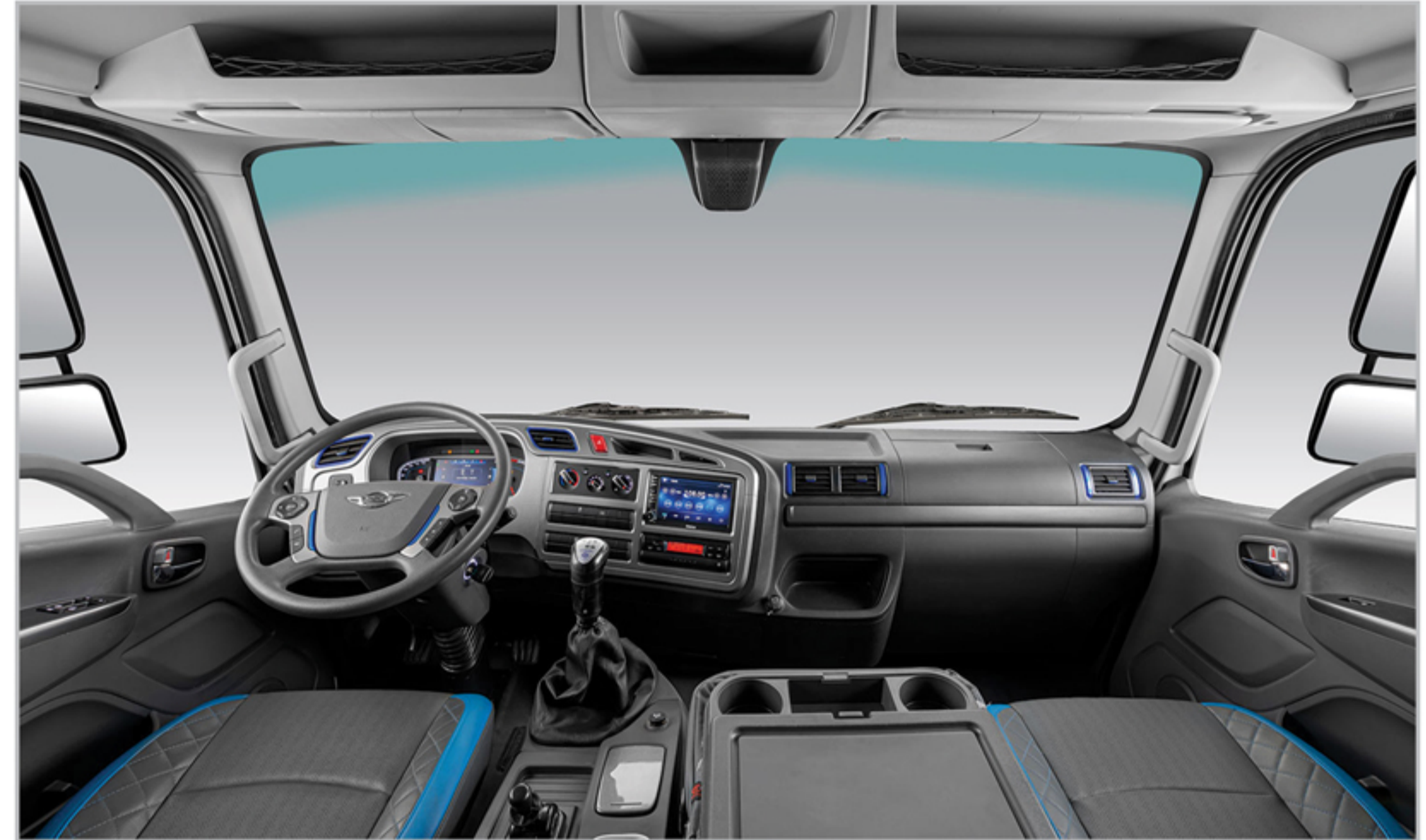
کابین بزرگ، ارگونومیک و مدرن