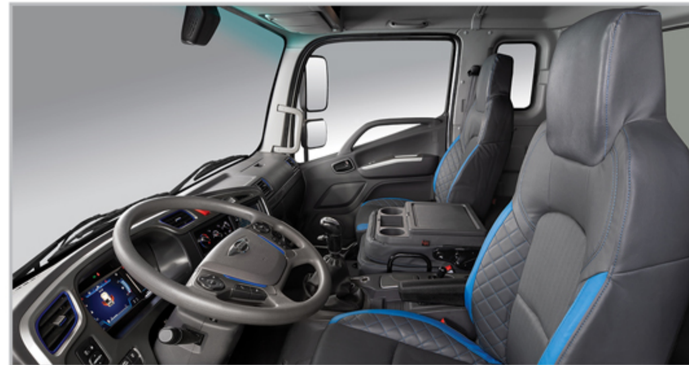
قابلیت تبدیل صندلی میانی به کنسول و جا لیوانی