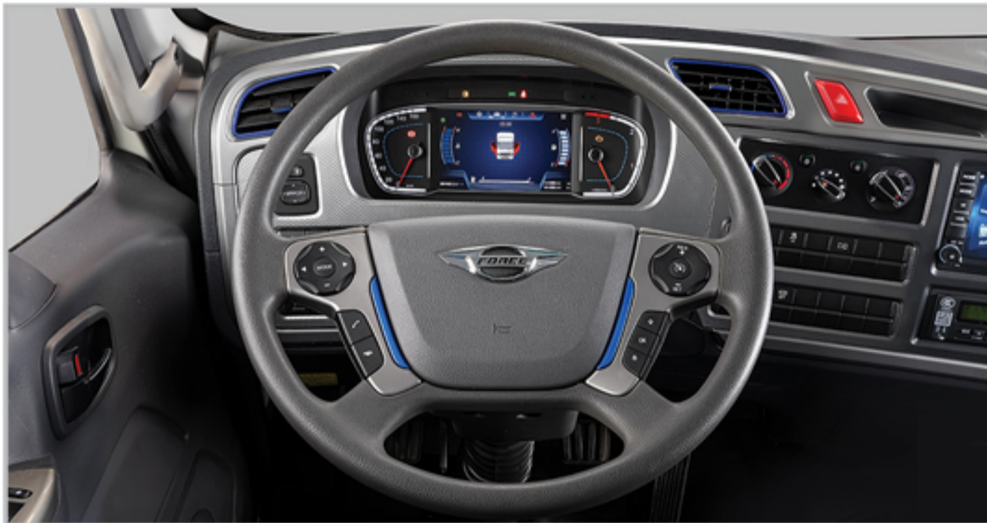
غریبک فرمان مجهز به کلیدهای دسترسی به مولتی مدیا و کروز کنترل