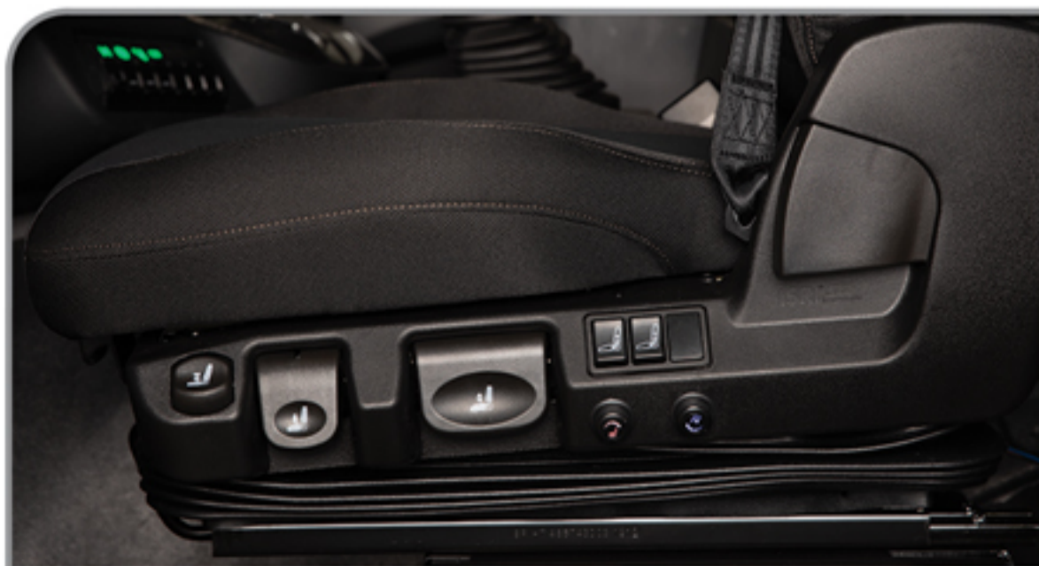
صندلی راننده با تعلیق پنوماتیک، دارای گرم کن و سردکن و قابلیت تنظیم در ۶ جهت