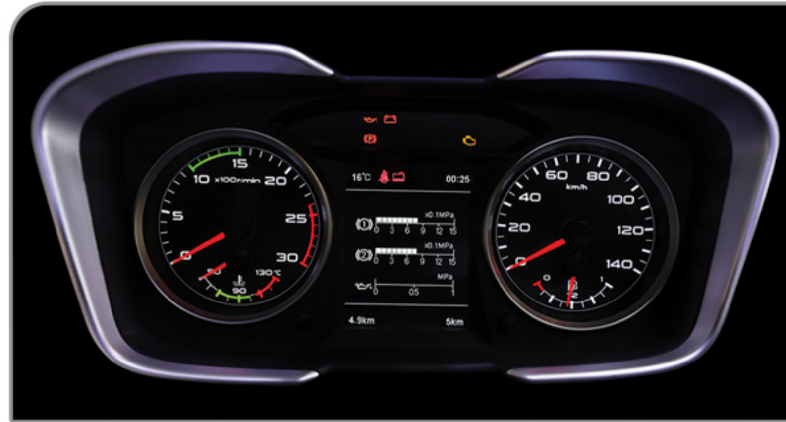
جلو آمپر با صفحه نمایش