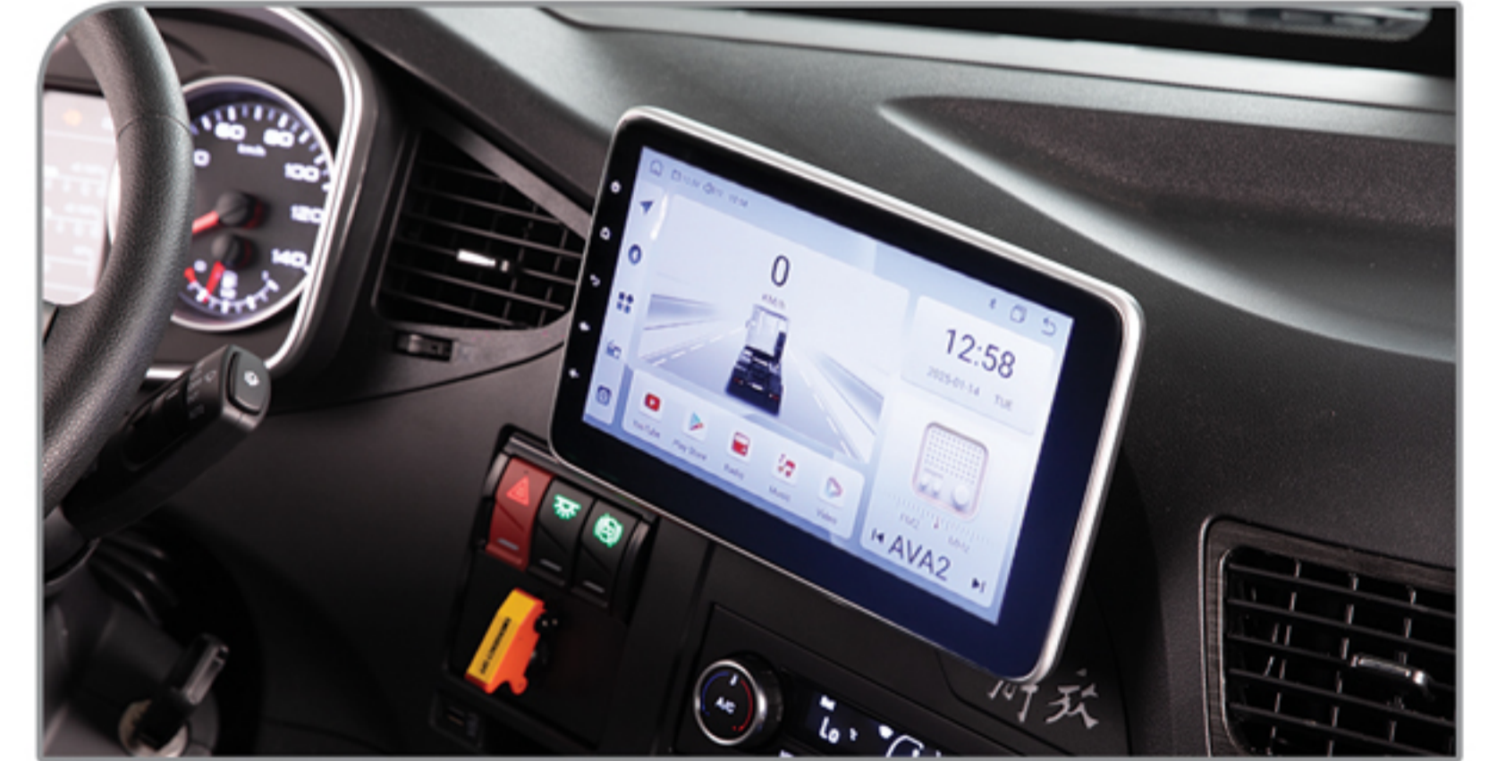
مولتی مدیا TFT لمسی (رادیو، رهیاب، بلوتوث، دوربین ۴ جهته، USB)