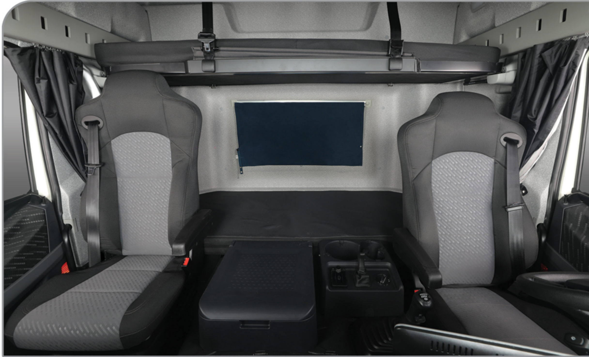
تخت خواب بزرگ