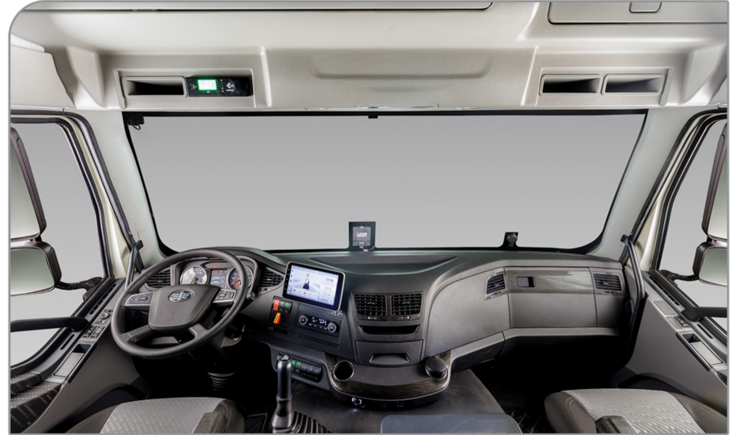
کابین بزرگ، ارگونومیک و مدرن