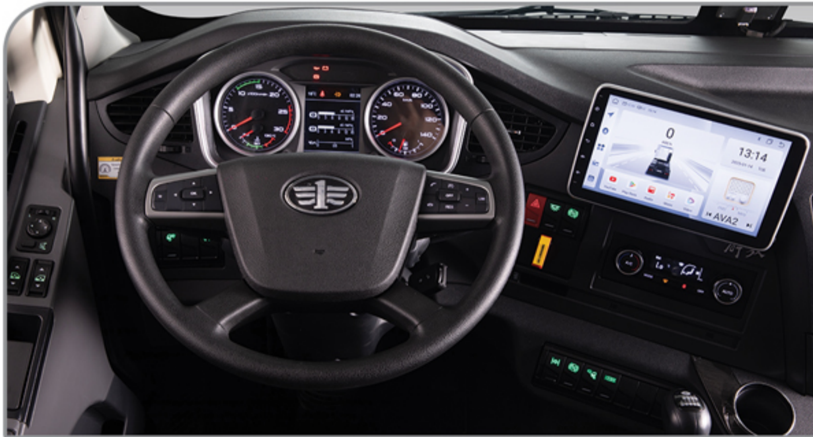
غریبک فرمان مجهز به کلیدهای دسترسی به مولتی مدیا و کروز کنترل